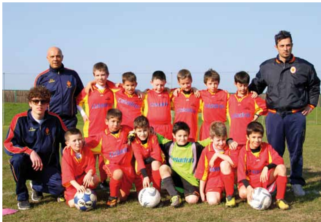
U.S. ARSENAL - PULCINI F.I.G.C. CATEGORIA 2005