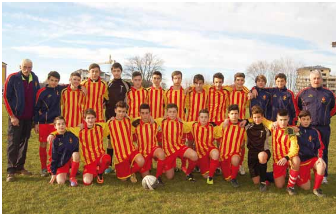
U.S. ARSENAL - GIOVANISSIMI B F.I.G.C. CATEGORIA 2000