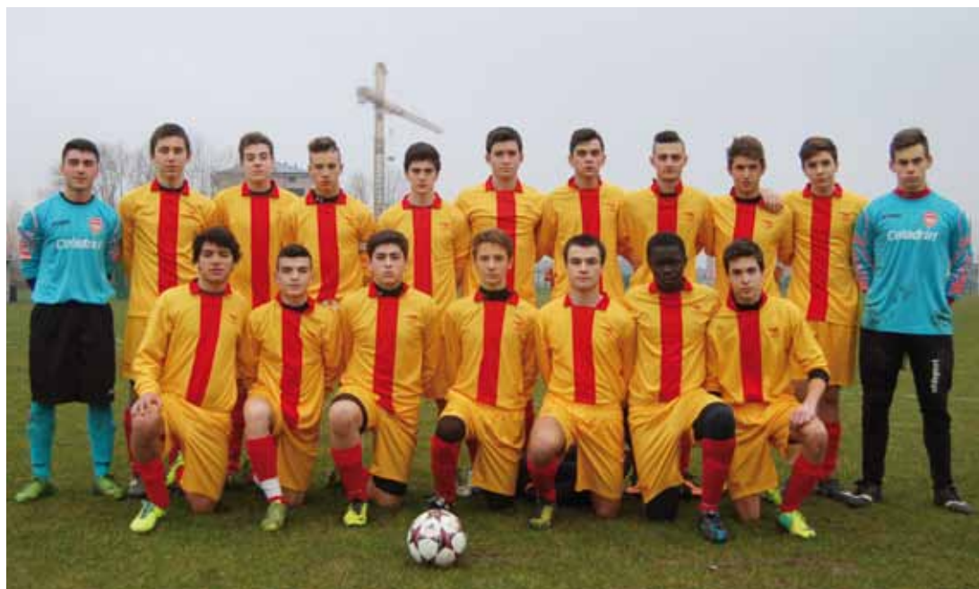
U.S. ARSENAL - ALLIEVI B F.I.G.C. CATEGORIA 1998