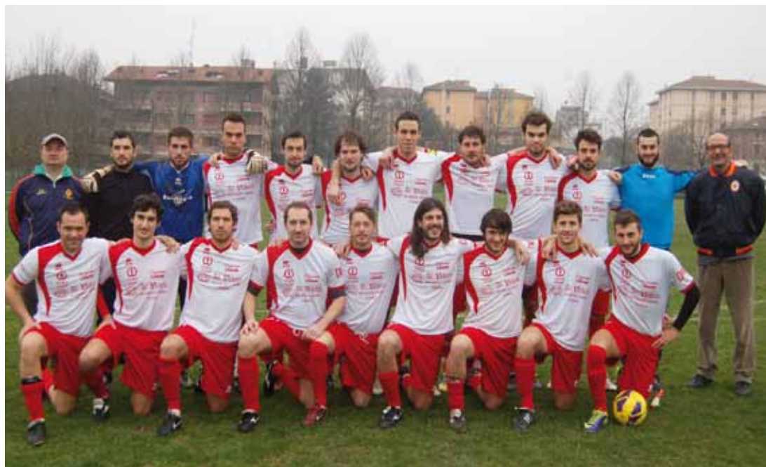
U.S. ARSENAL - TERZA CATEGORIA F.I.G.C.