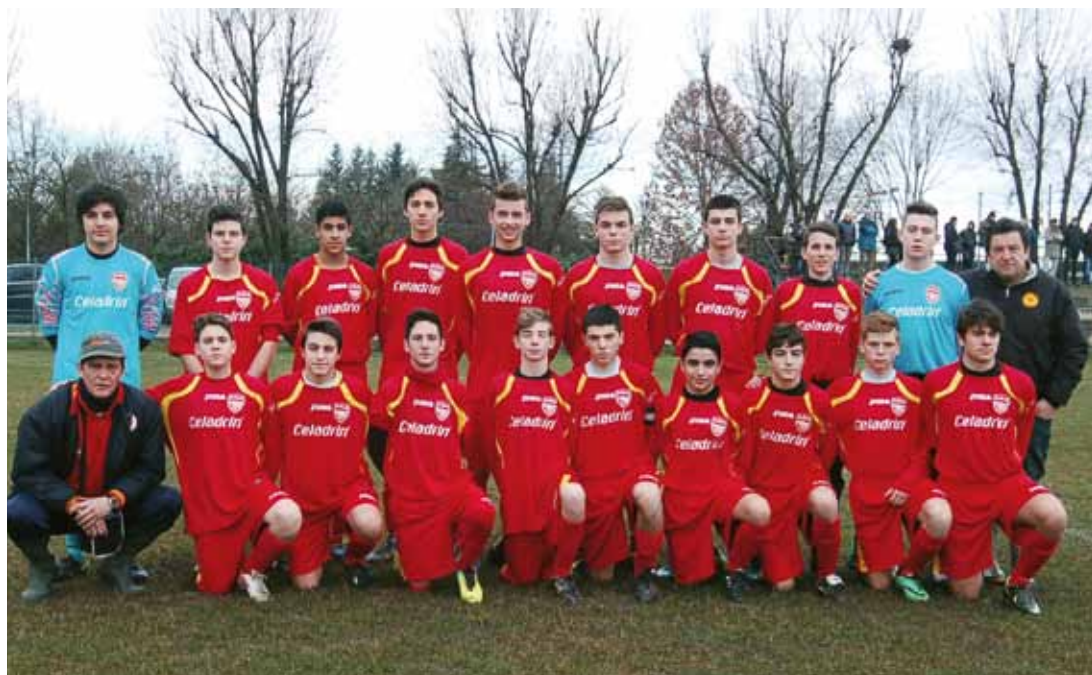
U.S. ARSENAL - GIOVANISSIMI A F.I.G.C. CATEGORIA 1999