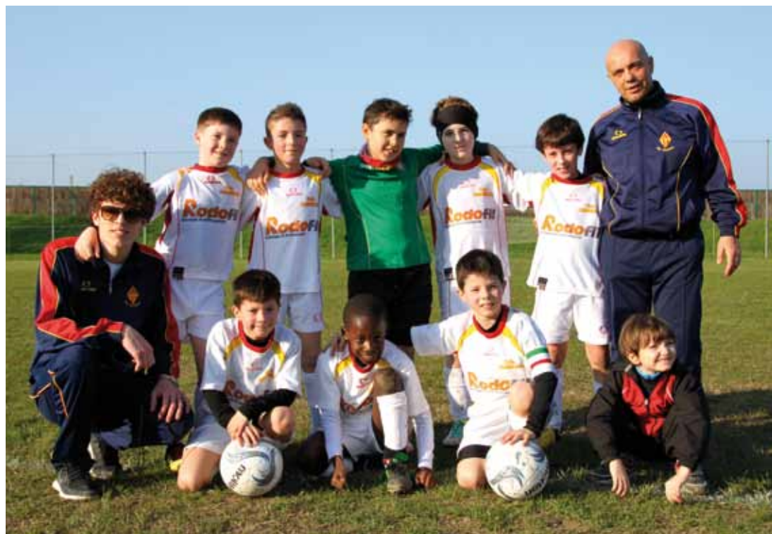
U.S. ARSENAL - PULCINI F.I.G.C. CATEGORIA 2004 / 2005