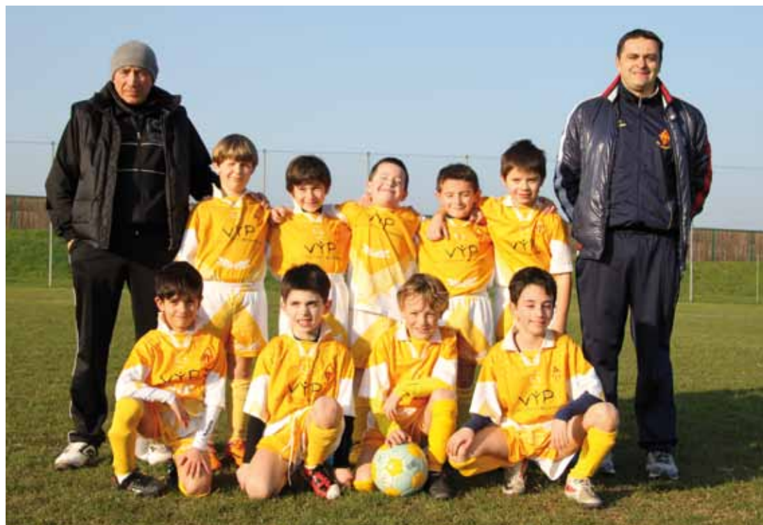
U.S. ARSENAL - OLIMPIA C.S.I. CATEGORIA 2006