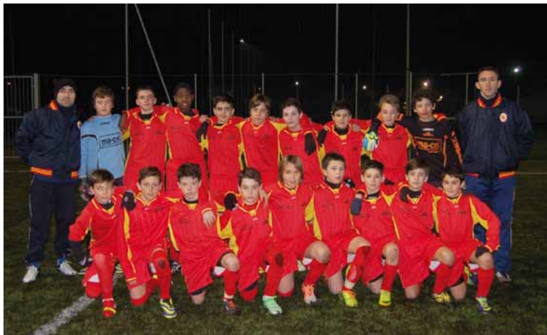
U.S. ARSENAL - ESORDIENTI A F.I.G.C. CATEGORIA 2001