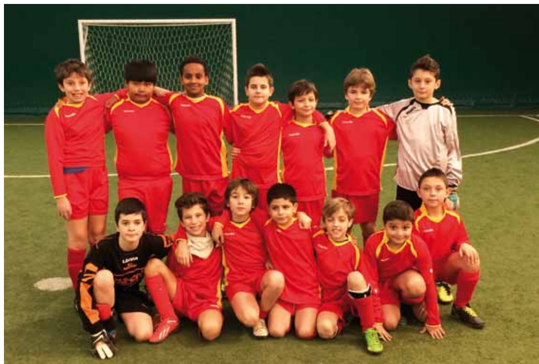
U.S. ARSENAL - PULCINI F.I.G.C. CATEGORIA 2004