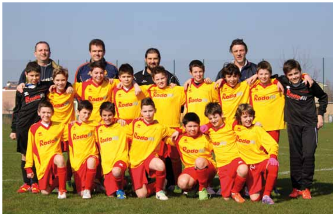
U.S. ARSENAL - ESORDIENTI B F.I.G.C. CATEGORIA 2002

Manutenzione campi sportivi in erba naturale e sintetica Giardinaggio Recinzioni e piccoli scavi