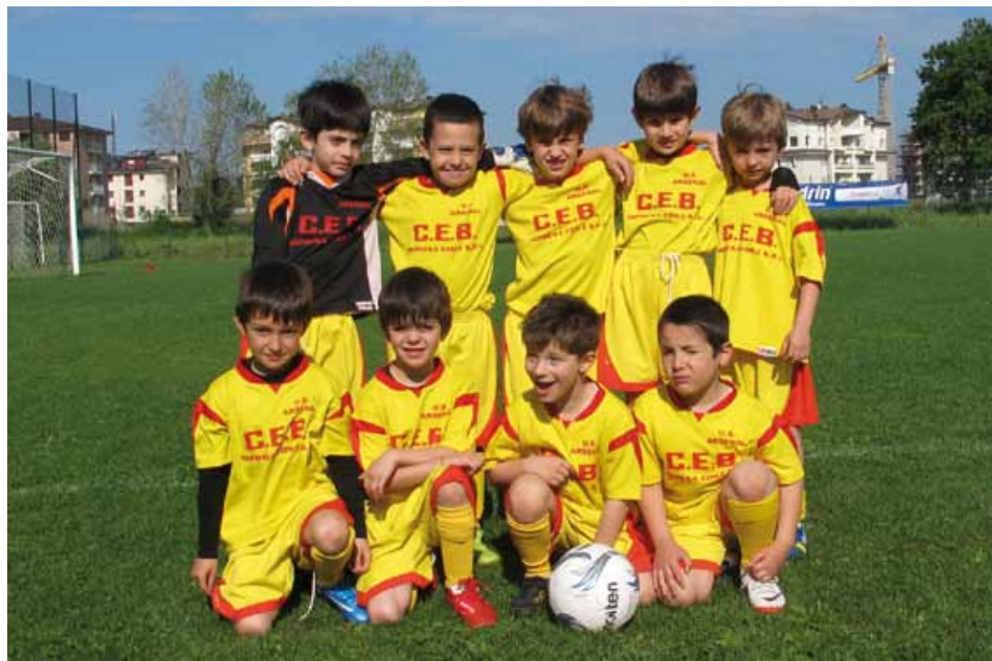
U.S. ARSENAL - SCUOLA CALCIO CATEGORIA 2007