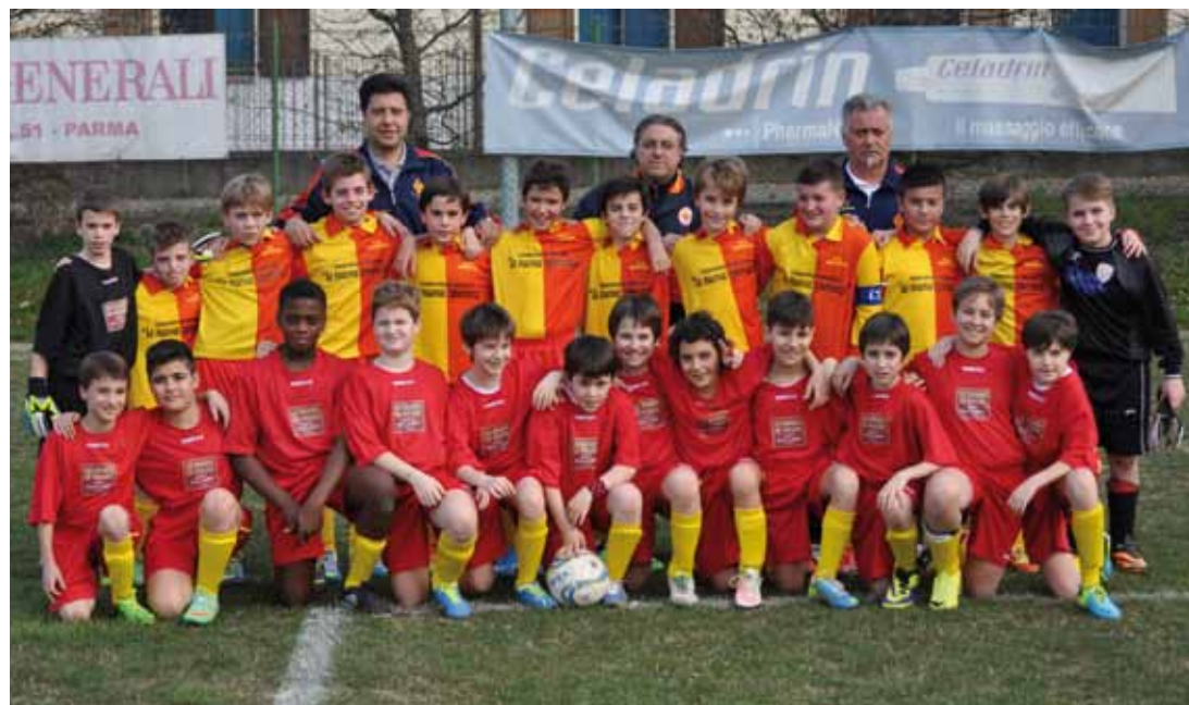
U.S. ARSENAL - PULCINI F.I.G.C. CATEGORIA 2003